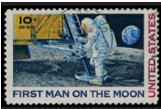
eerste man op de maan 1969