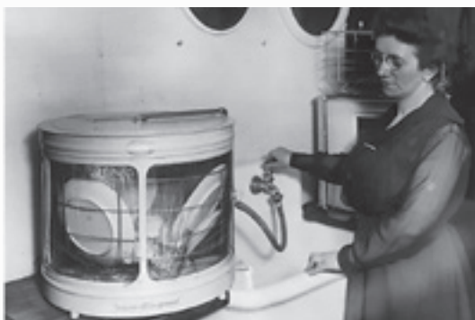
uitvinding vaatwasmachine 1886