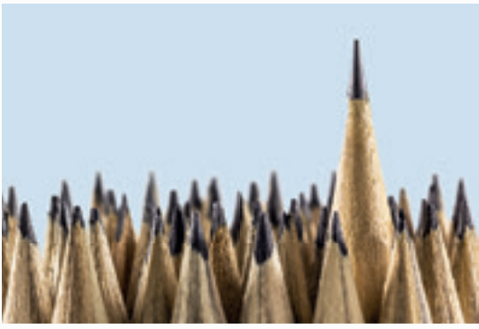
uitvinding potlood 1565