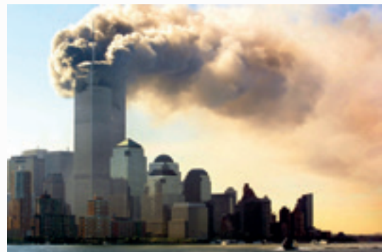
aanslag Twin Towers 2001