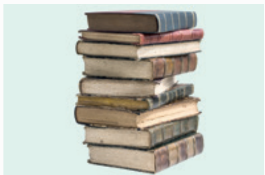
uitvinding boekdrukkunst 1440